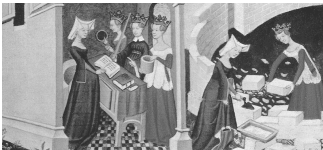
Εικόνα 2. Μικρογραφία από χειρόγραφο του βιβλίου Η Πόλη των κυριών ( La Cité des dames ) της Christine de Pizan

Αλλά ένα από τα σημαντικότερα και, τολμούμε να πούμε, πιο εξωφρενικά, παραδείγματα της μεροληπτικής προσέγγισης που ακολουθείται στο Κάλυμπαν βρίσκεται στη σελίδα 186 [της ελληνικής έκδοσης] όπου αναπαράγεται το εξώφυλλο του βιβλίου De Humanis Corporis Fabrica το οποίο εκδόθηκε το 1543 και το οποίο απεικονίζει τη δημόσια ανατομή ενός γυναικείου σώματος (Εικόνα 3). Δεν αναφέρεται πουθενά ότι ο συγγραφέας του βιβλίου είναι ο Βεσάλιος, ούτε ότι πρόκειται για το πρώτο εγχειρίδιο ανατομίας της νεότερης περιόδου,