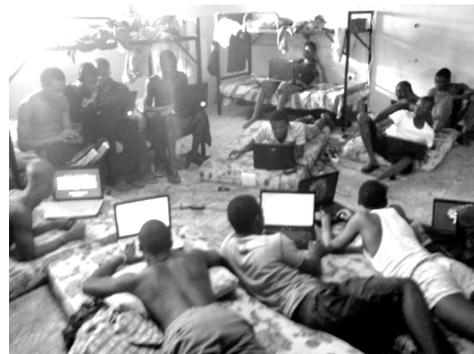
Yahoo boys εν ώρα εργασίας

Αυτές είναι απλώς οι πιο στοιχειώδεις απάτες που μεταχειρίζονται αυτοί που βρίσκονται στην κατώτερη βαθμίδα της πυραμίδας. Είναι οι απάτες στις οποίες εκτίθενται οι περισσότεροι άνθρωποι έξω από τη Νιγηρία. Δεν είναι οι απάτες που χρεοκόπησαν τη Banco Noroeste ή που δρομολογούν