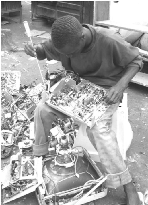
Ένας από τους χιλιάδες Νιγηριανούς που επισκευάζουν και μεταπωλούν μεταχειρισμένο ηλεκτρονικό εξοπλισμό.

Ποια η διαφορά; Οι δικτάτορες. Αυτή η αλληλουχία κυβερνητών ξεκλήρισε το εκπαιδευτικό σύστημα, ενίσχυσε τη «διαρροή εγκεφάλων» και δέσμευσε τόσο πολύ τη χώρα στο πετρέλαιο ώστε όλες οι άλλες δυνατότητες αυτοδύναμης ανάπτυξης να θαφτούν στο κόκκινο χώμα [χαρακτηριστικό χρώμα του χώματος στη Νιγηρία] προτού προλάβουν να πάρουν σάρκα και οστά. Ήταν η γέννηση της κλεπτοκρατίας. Η διαφθορά στην περίοδο από τις αρχές της δεκαετίας του 1980 έως και τα τέλη της δεκαετίας του 1990 έγινε τόσο ενδογενής ώστε να μη διακρίνεται από οτιδήποτε θα μπορούσε να αποκαλέσει κανείς «παράδοση». Λόγω όλων αυτών των καταστροφών η Ινδία έγινε ο βασικός αποδέκτης εξωτερικής ανάθεσης έργων στο Διαδίκτυο, την ώρα που η Νιγηρία έγινε έδρα της θρυλικής πλέον απάτης με την προκαταβολική χρέωση τελών, η οποία έχει γίνει γνωστή και ως απάτη 419, που είναι ο αριθμός του άρθρου περί απάτης στον ποινικό κώδικα της Νιγηρίας. Αυτές οι κομπίνες εμφανίστηκαν ακολουθώντας τα ίχνη του πετρελαϊκού πλούτου κατά την εποχή των δικτατόρων αλλά έφτασαν πλήρως εξελιγμένες στα σπίτια όλου του κόσμου με τους υπολογιστές. Το γεγονός ότι ξεκίνησαν ως τοπικές χειρόγραφες επιστολές που στη συνέχεια ταξίδεψαν παγκοσμίως μέσω των φαξ και του διαδικτύου και σήμερα διαδίδονται ανεξέλεγκτα μέσω SMS και κινητών τηλεφώνων δείχνει την ταυτόχρονη εξέλιξή τους με την τεχνολογία των επικοινωνιών στη Δυτική Αφρική.