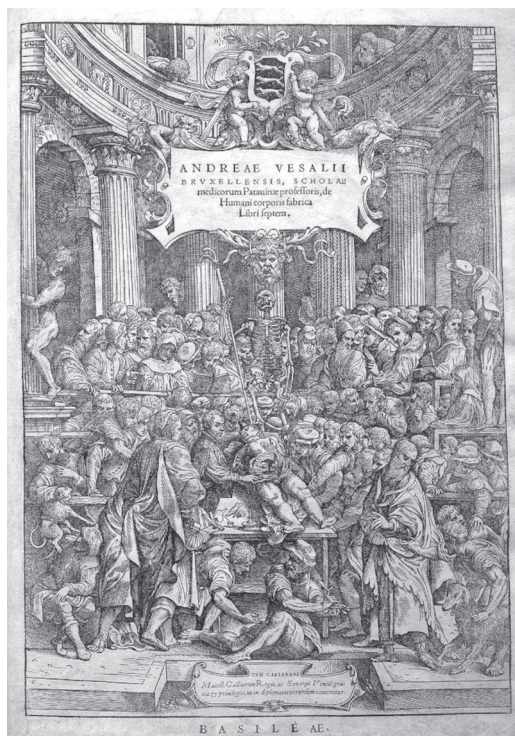
Εικόνα 3. De Humanis Corporis Fabrica

το οποίο θεωρείται σημείο καμπής στην ιστορία της ιατρικής, όπου επιχειρείται, για πρώτη φορά, η σωστή αναπαράσταση του ανθρώπινου σώματος (συμπεριλαμβανομένων των γυναικείων γεννητικών οργάνων). Για τη Φεντερίτσι, η σκηνή απεικονίζει κάτι άλλο: «Ο θρίαμβος του αρσενικού, των ανώτερων τάξεων και της πατριαρχικής τάξης πραγμάτων μέσα από τη συγκρότηση του νέου θεάτρου της ανατομίας δεν θα μπορούσε να είναι πιο απόλυτος». 16